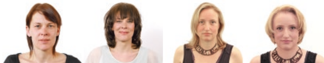
Mehr Vorher-nachher-Bilder unter www.sastre.company